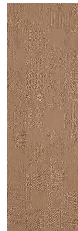
Déchirer XL Avana * 100-300 cm * 39"-118"