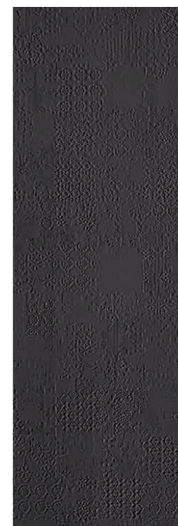
Déchirer XL Grafite * 100-300 cm * 39"-118"