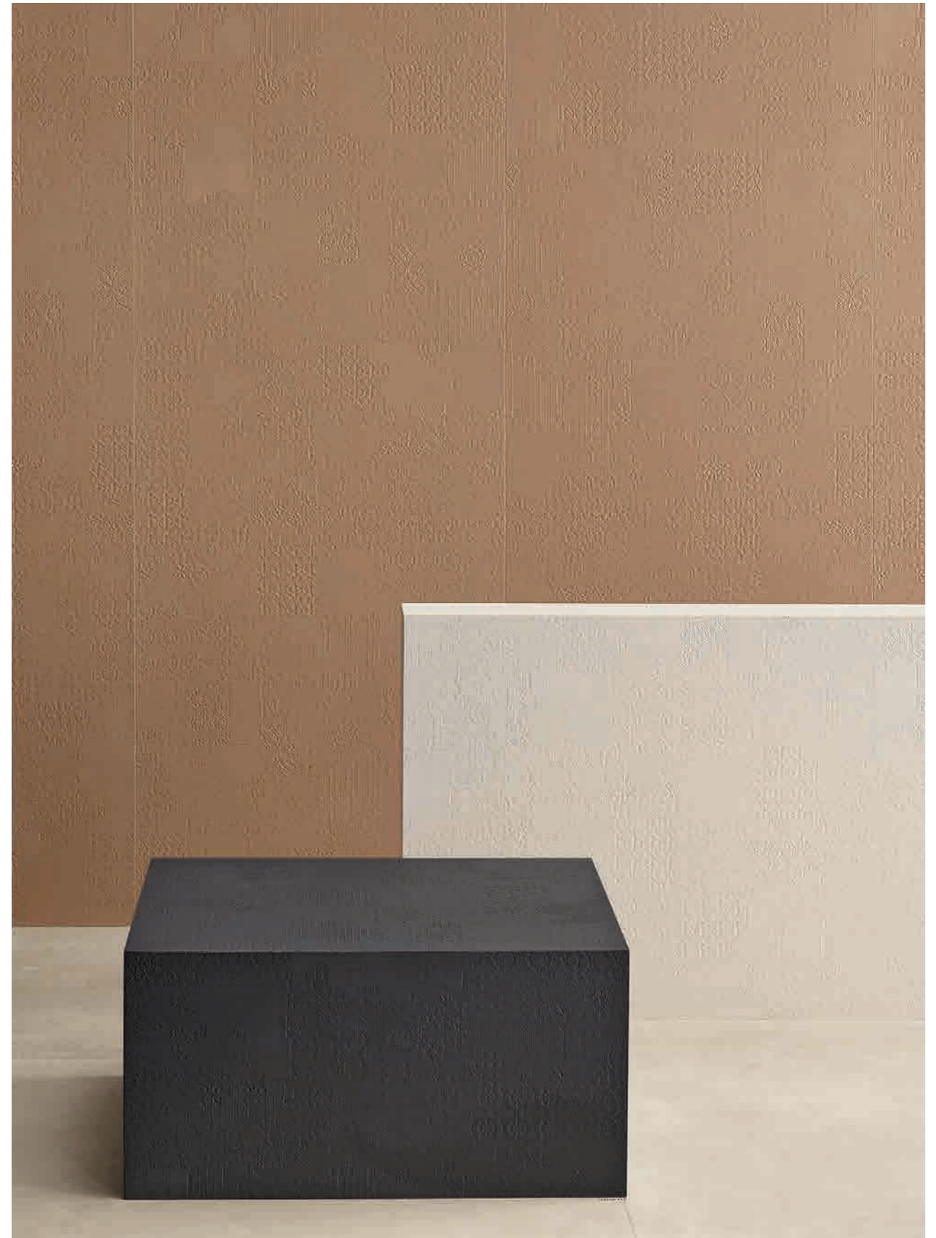
This page: Avana, Gesso, Grafite. Opposite page: Gesso.