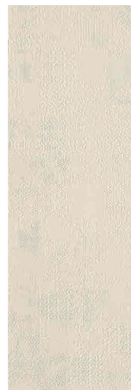
Déchirer XL Gesso * 100-300 cm * 39"-118"

Modello depositato piastrelle n° 001615790-001 – data di deposito: 25/09/2009 Registered design n° 001615790-001 – date of registration: 25/09/2009 Modello depositato piastrelle n° 001615774-001 – data di deposito: 25/09/2009 Registered design n° 001615774-001 – date of registration: 25/09/2009