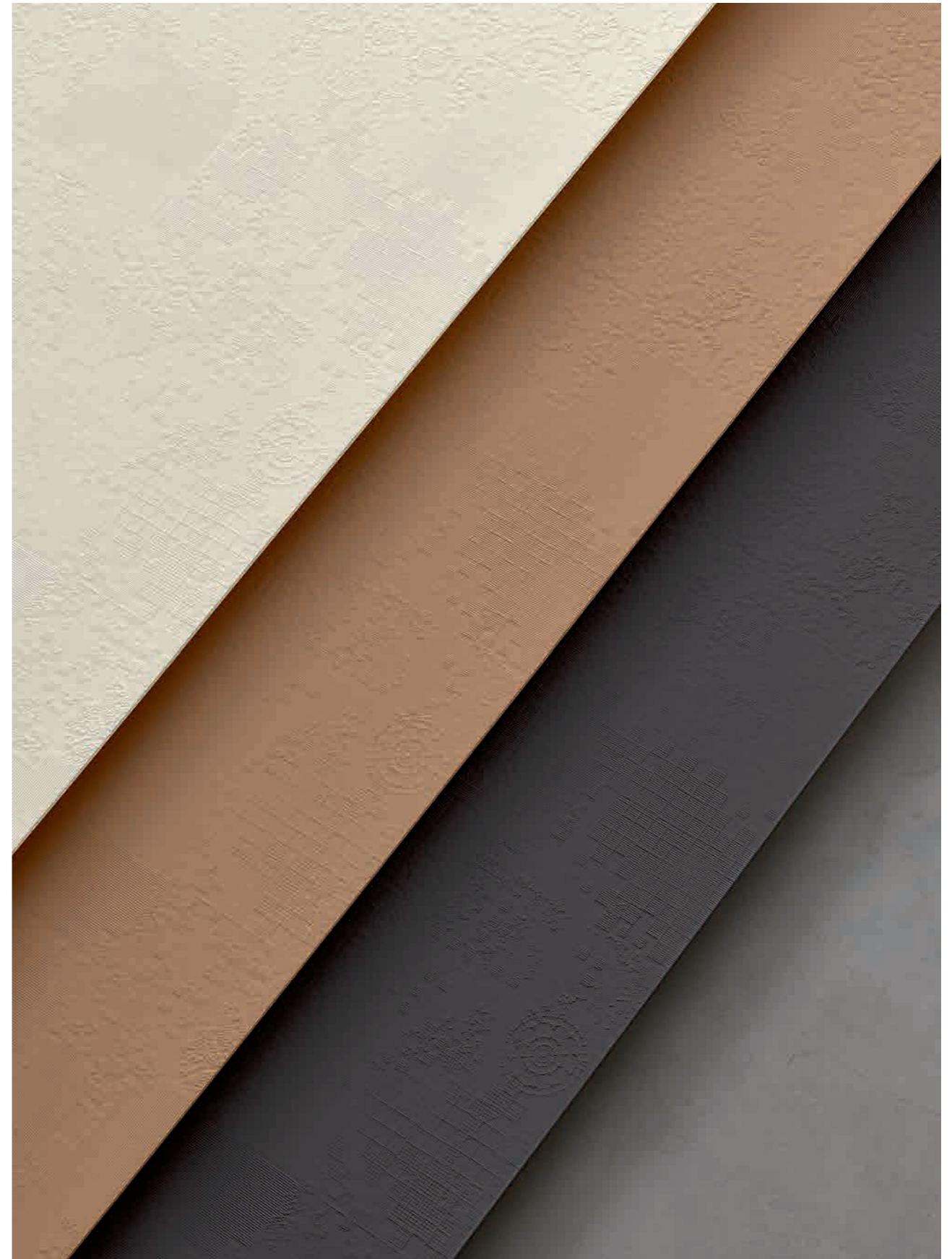
Gesso, Avana, Grafite